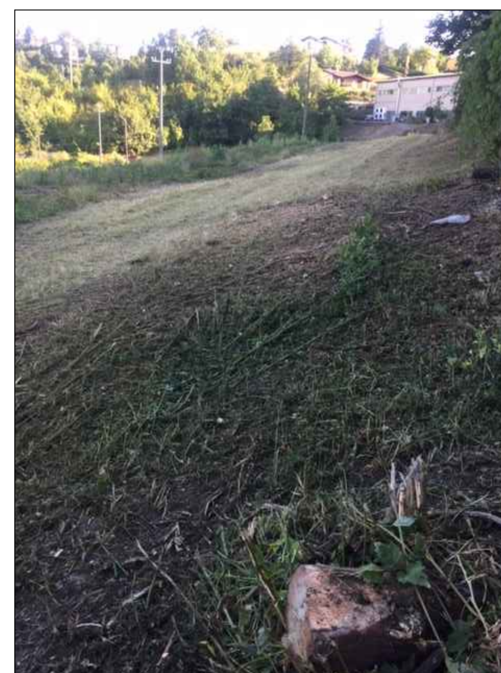
FOTO F4 - RIPRESA dalla parte alta del MAPPALE 9 SOTTO CONDOMINIO POLI