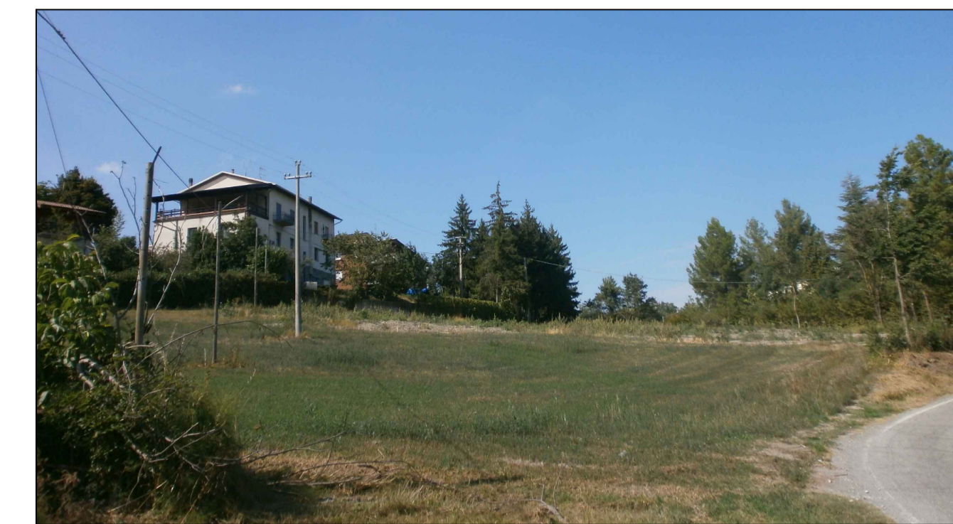
FOTO F2 - RIPRESA DALLA EX SS 63 - IN LONTANANZA PARTE DELL'EDIFICIO Mapp. 484 ED EDIFICI Mapp.li 5 E 4 SI VEDA NELL'ANGOLO A DESTRA LA PINETINA DI ABETI SULLA DESTRA SI NOTANO I 5 ACERI CAMPESTRI E I 2 OLMI