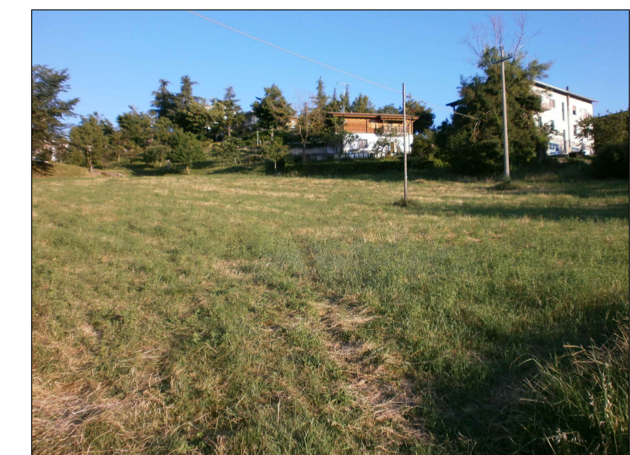
FOTO F3 - RIPRESA DAL Mapp. 37 - IN LONTANANZA EDIFICIO Mapp. 484 ED EDIFICI Mapp.li 5 E 4 SI NOTI LA FOLTA VEGETAZIONE CHE PROTEGGE IL MAP. 5