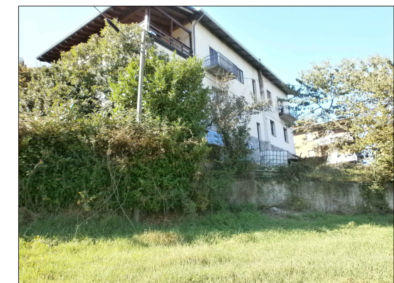
FOTO F7 - FOLTA VEGETAZIONE IN ADIACENZA E SOTTO IL MAPPALE 5