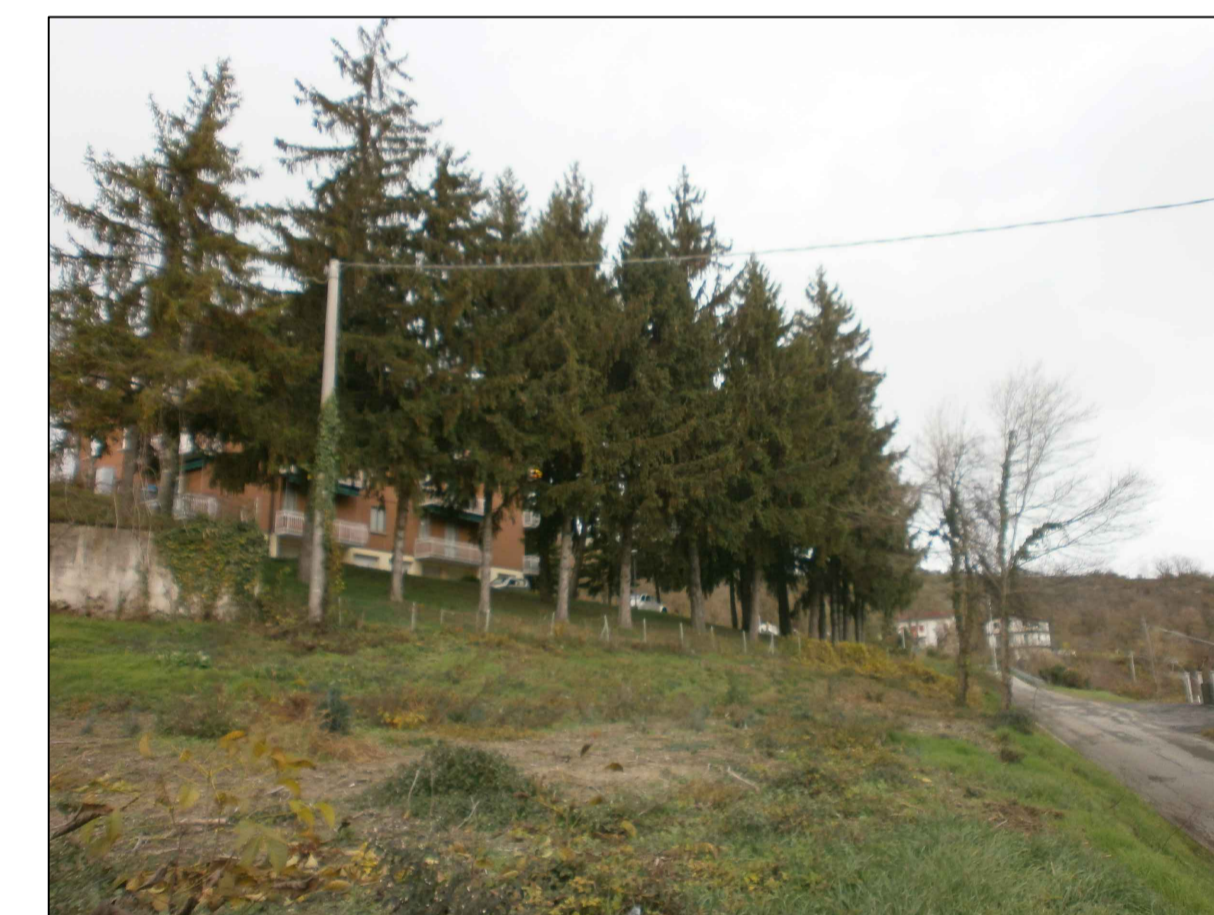
FOTO F5 - FILARI DI ABETI A PROTEZIONE DEL MAPPALE 2